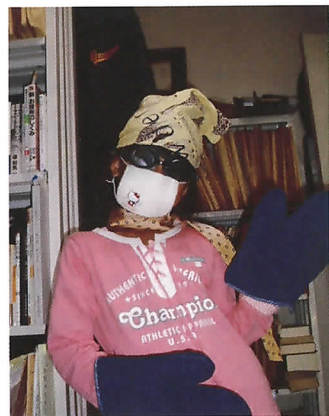
ただ者ではない風格が漂う…