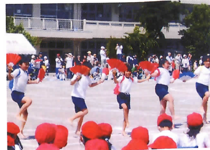
娘たちの晴れ舞台・運動会へ足を運ぶ

「おとこもすなる日記というものをおんなもしてみむとするなり」(土佐日記)。現代であれば、「学生もすなるブログというものをおじさんもしてみむとするなり」。『歩き方』恒例(?)、政経おやじ教員のブログ風日記2007の公開じゃー。