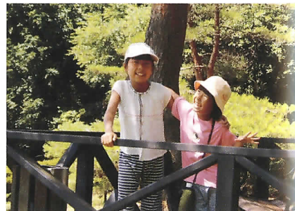
子どもたちといっしょに過ごせるのが至福のとき、かな？

芸の世界の師弟関係の濃さ。6時15分ごろ帰宅。子どもたちと夕食をいっしょにとれてよかった。9時半ごろ寝る。